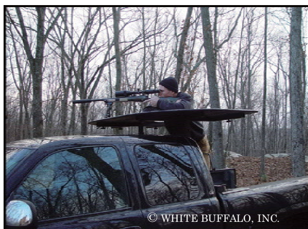
図1. ピックアップトラックを利用した狙撃のイメージ図.

○餌を運ぶ車と同じピックアップトラックの荷台に射手と記録係が乗って、運転席位置の天井にコンパネ製の射撃台を設置し、その上にバイポッドを乗せて狙撃する（図1）。積雪期には、爆音器脇まで除雪を行い、ピックアップトラックを乗り付けることが可能な状態として、積雪期前と状況を変えないようにして射撃を行う。