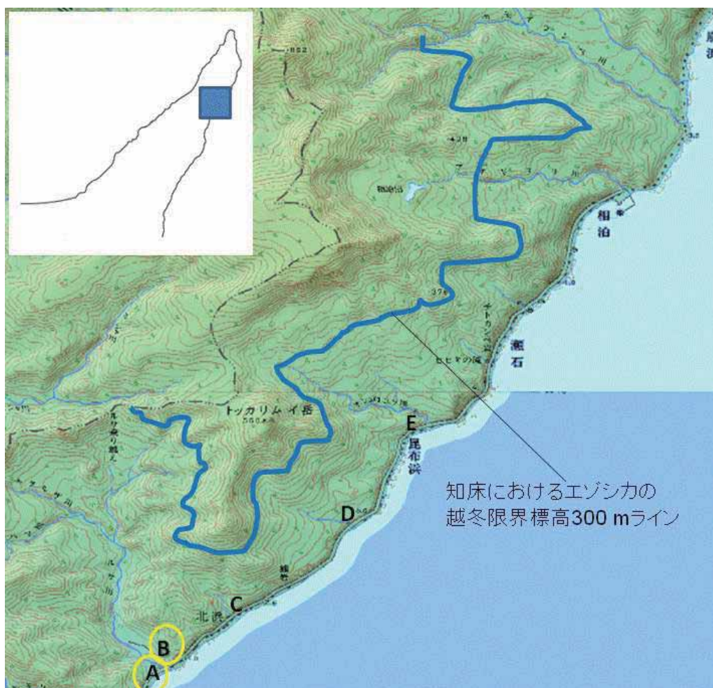
図4. ルサ相泊地区の全体図.AはSS実施地点、Bは囲いワナ設置地点を示す。