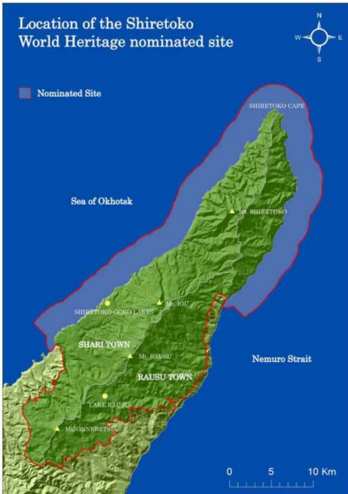
Carte 2: Limites du bien proposé