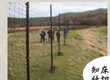
知床岬の仕切り柵