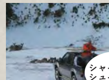
シャープシューティング

餌付け場のシカの頭や首をライフル銃で狙撃する方法。シカが逃走して警戒心を高めないう、その場のシカを全滅させます。