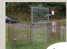
囲いワナの自動落下ゲート