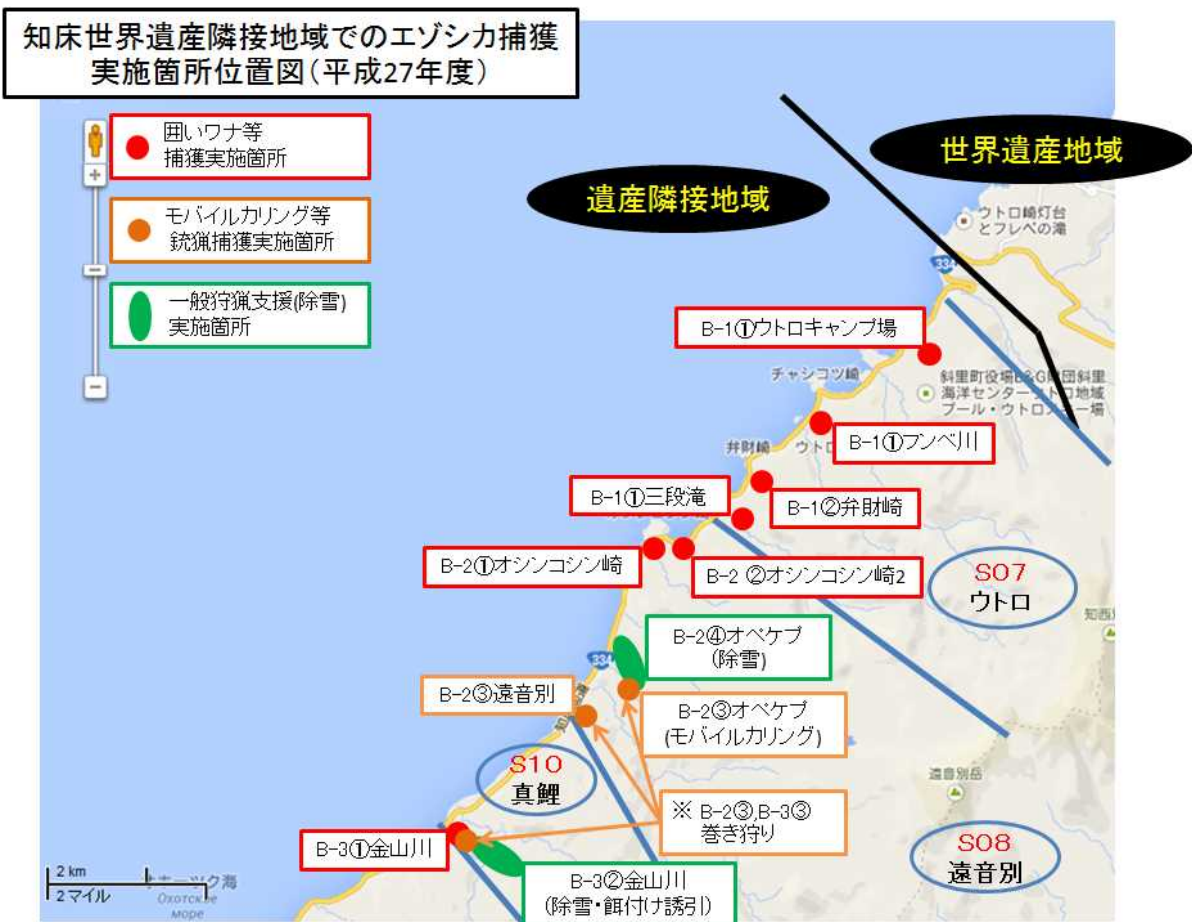
図 3 : 知床世界遺産隣接地域でのエゾシカ捕獲実施箇所位置図 (平成 27 年度)