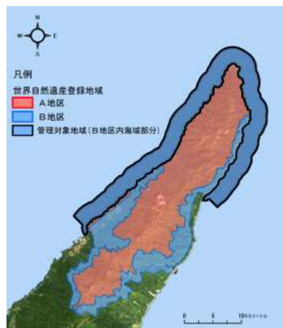
図 1 管理対象地域